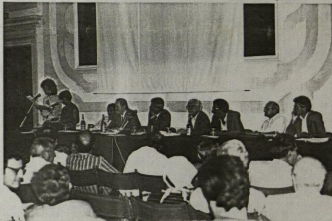
Un moment dal "FORUM" di vile Manin -20.09.87

Te relazion ancjemò, si palêse la dibisugne di "cheste iniziative, in tun moment che i valôrs da furlanità e de autonomie 'e vegnin considerâts in setôrs ch'a no si sares mai spetât "e in presince dal risi che" i partîs si butin ae spartizion dal patrimoni pulitic e storic dal MF". Si ribadis ancjemò "l'indipendence dal comitat da ogni condizionament pulitic, comprindût chel dal Moviment Friûl che, dutcas, al'â promovude la sô costituzion", il so caratar di "analisi e di studi, almanac te prime fase di ativitât", e il fat che il "forum" di Passarian al'ûl jessi "no il lûc dal regolament di conts jenfri lis diviarsis animis dal autonomisin furlan fûr e drenti il MF", ma ocasion par un confront su di une quistion